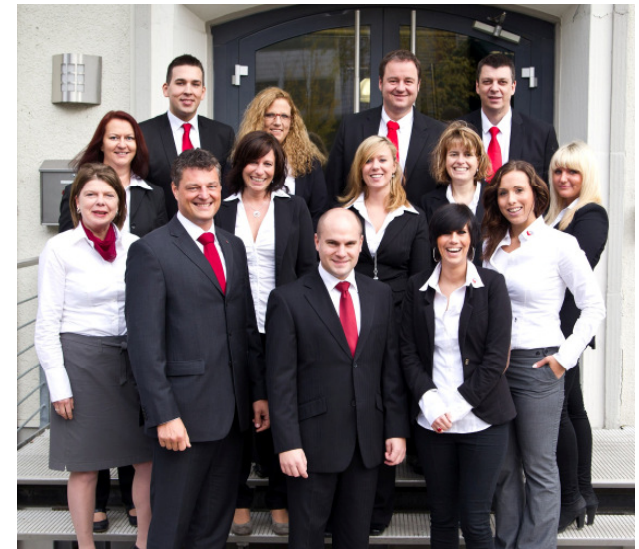
Unser Team der Disposition und Mitarbeiterbetreuung